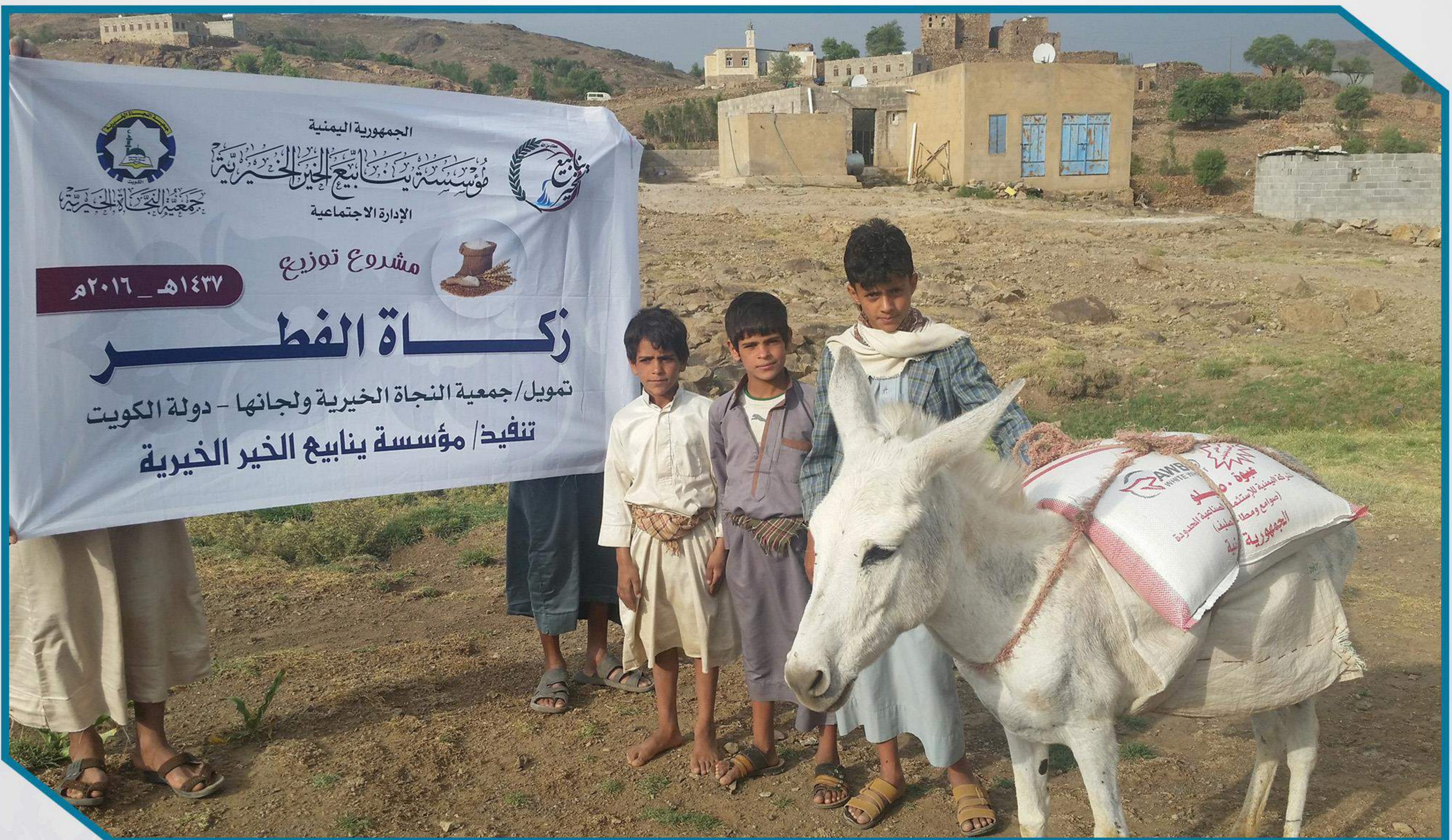
المشاريع الممولة من جمعية النجاة الخيرية ولجانها 1437 هـ - 2016 م